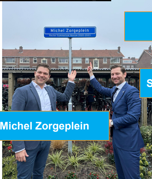
Onthulling bord Michel Zorgeplein