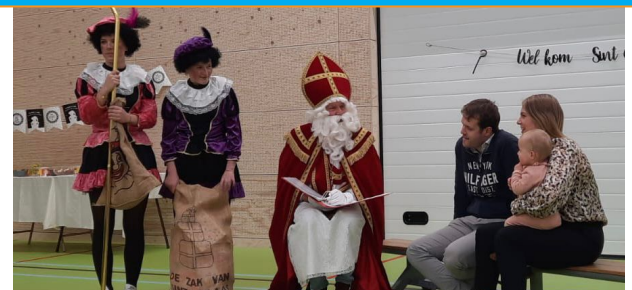
Sinterklaas voor kinderen van collega's

Het hele team van Gymnasium Novum wenst u een fijne Kerstvakantie!