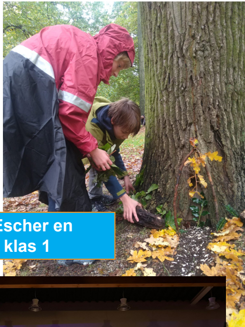
Novumdag Escher en wiskunde klas 1